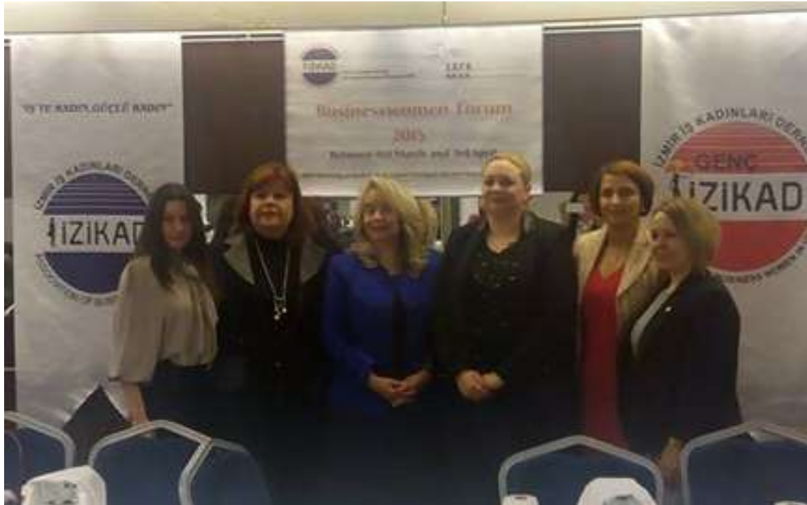
Διεθνές Forum Επιχειρηματικότητας & B2B συναντήσεις – Izmir 2015